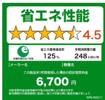
(冷蔵庫のイメージ※)