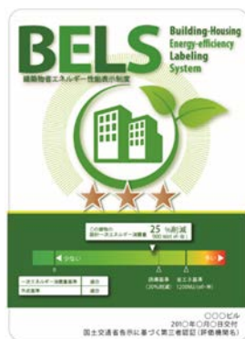
〔図1〕 ガイドラインに基づく第三者認証の例

また、ダイヤモンドリスponsに対応した時間帯別・季節別の電気料金メニューが選択できる場合はその活用にも努めるとともに、エネルギー管理システム（BEMS・HEMS等）の導入により、ビルの運用方法、住宅の住まい方の改善によるピーク対策及び省エネルギーに努めること。